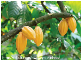
http://tiff.uk.com/swan-your-choc/ (樹上のカカオの実、小さなラグビーボールくらい)

ココアとは、カカオ（南米原産）の種子（カカオ豆）を発酵・焙煎させた後、ココアバターを搾油した残りの固形分（ココアケーキ）、またはその粉末（ココアパウダー）のこと。チョコレートは、カカオ豆を焙煎、粉碎、ペースト状にしたもの（カカオニブ）をベースにして、砂糖を加え、練り上げて作られる。