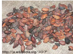
http://ja.wikipedia.org/ココア (内部に、親指大の種子が詰まっている)

うな脳機能改善効果も期待されている。ココアの習慣的な摂取によって、高血圧が予防可能との報告もある。